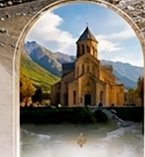
มัทสเคต้า UNESCO HERITAGE