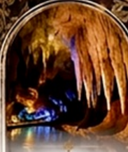
ดำโพรมิริอัส BOAT RIDE

เดินทางช่วงปีใหม่ 27 ธ.ค. - 3 ม.ค. 70 ราคาเพียง 75,989 บาท / ท่าน