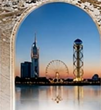
บากูมี BLACK SEA BOULEVARD