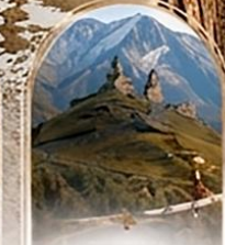
คาสเบก 4WD EXPERIENCE