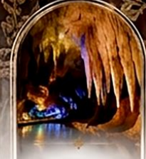
ดำโพรมีรีอุส BOAT RIDE

เดินทางช่วงปีใหม่ 27 ธ.ค. - 3 ม.ค. 70 ราคาเพียง 75,989 บาท / ท่าน