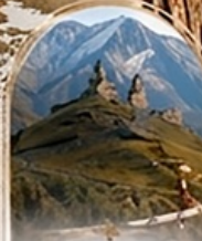
คาสเบกี 4WD EXPERIENCE