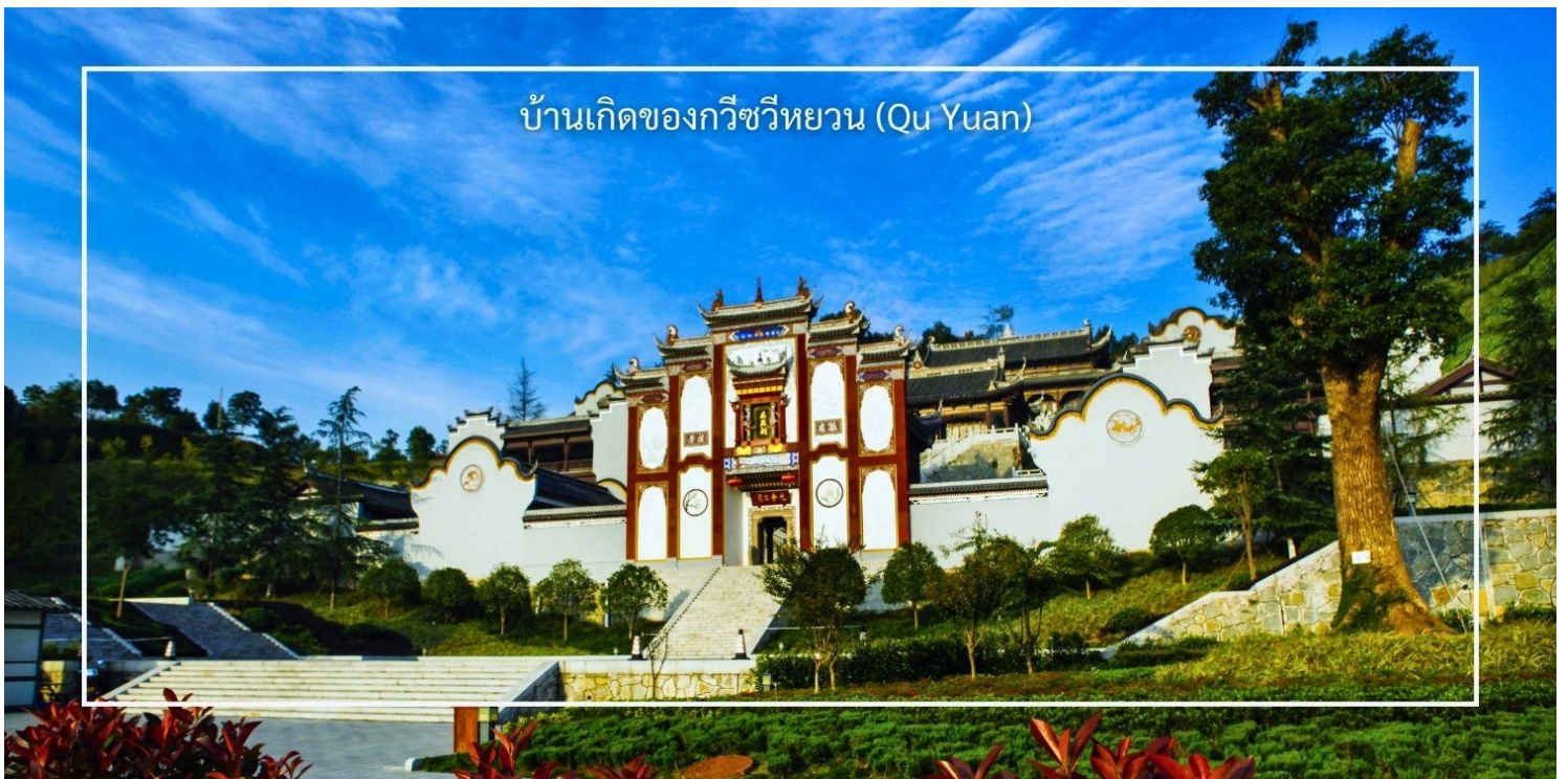
บ้านเกิดของกวีชวีหยวน (Qu Yuan)

นำท่านเดินทางสู่ บ้านเกิดของกวีชวีหยวน (Qu Yuan) สถานที่เกิดของบุคคลสำคัญทางประวัติศาสตร์และวรรณกรรมของประเทศจีน ผู้ได้รับการยกย่องว่าเป็นกวีผู้ยิ่งใหญ่แห่งยุครัฐจ้านกั๋ว และเป็นสัญลักษณ์แห่งความซื่อสัตย์และความจงรักภักดี บ้านเกิดของชวีหยวนตั้งอยู่ริมแม่น้ำแยงซีเกียง เป็นสถานที่ที่สะท้อนเรื่องราวชีวิต แนวคิด และผลงานทางวรรณกรรมอันทรงคุณค่า ซึ่งมีอิทธิพลต่อวัฒนธรรมจีนสืบต่อมาจนถึงปัจจุบัน (รวมรถแบตเตอรี่)