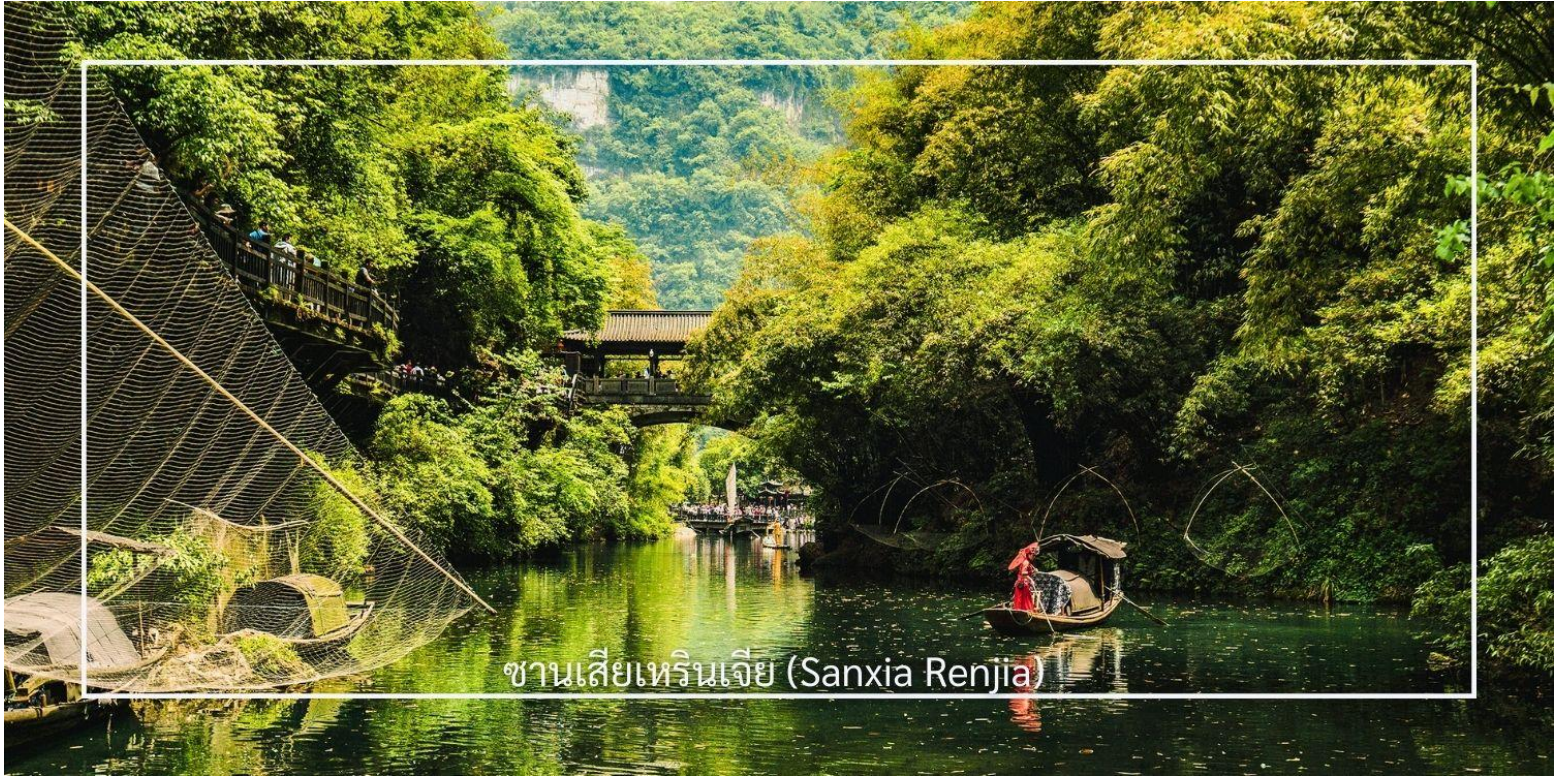
ซานเสี่ยเหรินเจีย (Sanxia Renjia)