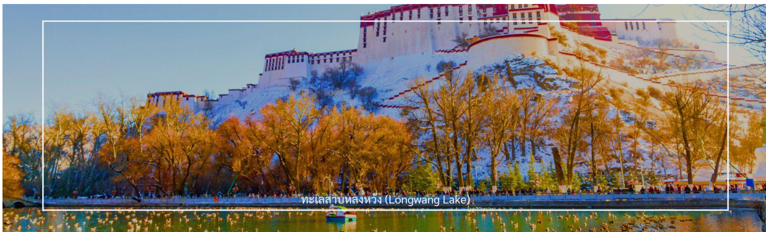
ทะเลสาบหลงหวัง (Longwang Lake)

เป็นหนึ่งในจุดท่องเที่ยวที่น่าสนใจในอุทยานปีนังโกว ทะเลสาบนี้มีความงดงามทางธรรมชาติและเป็นที่รู้จักในด้านทิวทัศน์ที่สวยงามและบรรยากาศที่เงียบสงบ มีน้ำที่ใสสะอาดและมีสีฟ้าอ่อน สามารถมองเห็นการสะท้อนของภูเขาและท้องฟ้าในน้ำ ทำให้เป็นสถานที่ที่เหมาะสมสำหรับการถ่ายภาพ