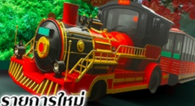
รายการใหม่

รวมภาษีน้ำมันเชื้อเพลิง และภาษีสนามบินแล้ว