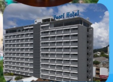
โรงแรมเพิร์ล