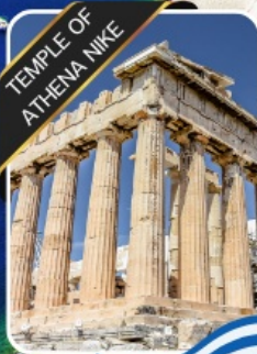
TEMPLE OF ATHENA NIKE