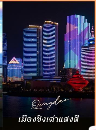
Qingdao เมืองชิงเต่าแสงสี