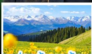
ทุ่งหญ้าคาราจิ้น