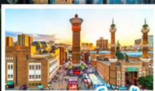
ตลาดแกรนด์บาซ่า