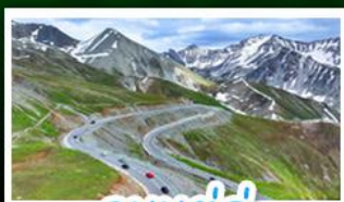
ถนนตุ่กู๋

อุทยานเซี่ยถ่า - ไช่หลี่มู่ คาราจิ้น - ถนนตุ่กู๋ ตลาดแกรนด์บาซ่า - กุ้งเหวินคาราจิ้น