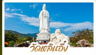
วัดเล่ินเอ็ง