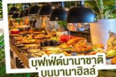
บุฟเฟ่ต์นานาชาติบนบานาฮิลล์