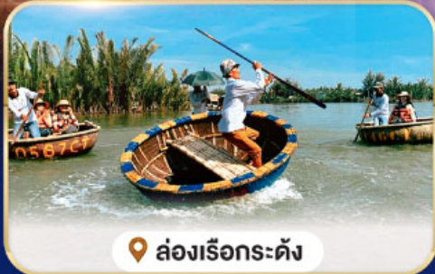
📍 ล่องเรือกระดัง

เมนูพิเศษ 1 อิ่มอร่อยกับบุฟเฟ่ต์ นานาชาติบนบานาฮิลล์ และ หนี้อไฟเวียดนาม พร้อมเสิร์ฟทั้งมืงรท่นลละคร้งค้ว