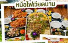
หม้อไฟเวียดนาม