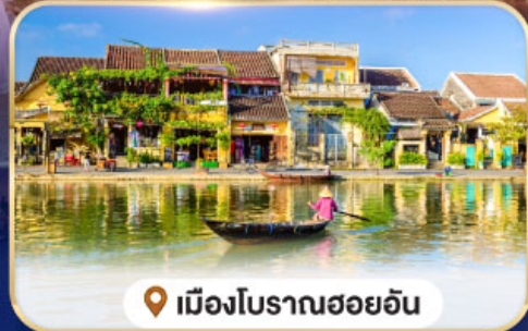
📍 เมืองโบราณฮอยอัน