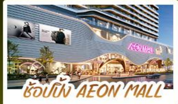
ช้อปปิ้ง AEON MALL