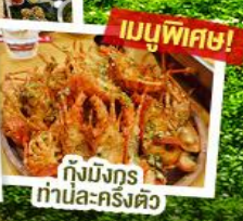
กึ่งมังกรท่านละครึ่งตัว