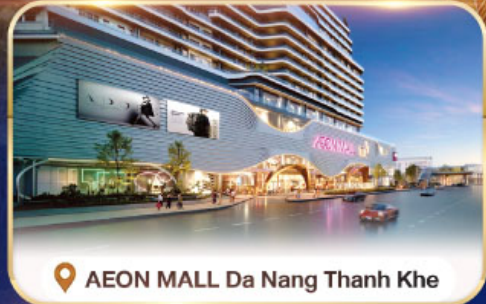
📍 AEON MALL Da Nang Thanh Khe