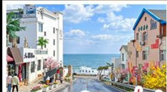
ถนนคอปเปลิ่งสาขาที่เปิด