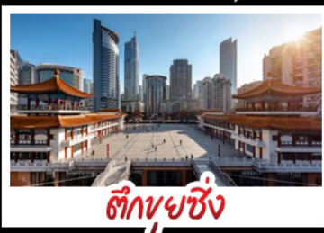
ตึกขุยซิ่ง

พระแกะสลักหินต้าจู้ - หลุมฟ้าสะพานสวรรค์ - เวนางฟ้า ตึกขุยซิ่ง - ตึกตะเกียบ - หมู่บ้านโบราณฉือซีโจว