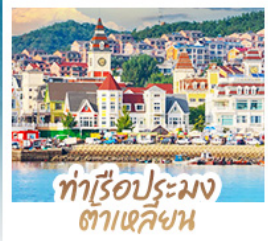
ทำเรือประมง ต้าเหลียน