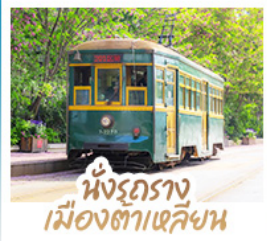
นั่งรถราง เมืองต้าเหลียน