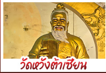
วัดเว้งต้าเซียน

ไฮไลท์ วัดเจ้าแม่กวนอิมฮ่องกง - กระเช้ามองปิง พระใหญ่โป่วหลิน - เจ้าแม่กวนอิมรพีลส์เบย์ วัดแซกงหมิว - วัดหวังต้าเซียน - วัดเจ้าแม่ทับทิม