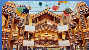
ต้องสัมผัสตึกราม