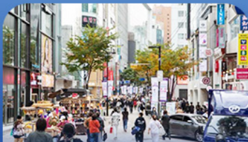
ช้อปปิ้งผ่านเม็ชงดง