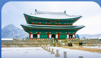
พระราชวังเจ็ชงบก

สัมผัสเสน่ห์ฤดูหนาวเล่นหิมะแบบจัดเต็มที่สุดที่รีสอร์ท พร้อมกิจกรรมสุดมันส์ทั้งสกี สโนว์บอร์ด และสโนว์สไลด์ ก่อนสัมผัสไฮไลท์สุดว้าว ณ ทะเลสาบชินจง ลานน้ำแข็งธรรมชาติ ขนาดใหญ่ที่เปิดให้สนุกกับการตกปลาแม่น้ำแข็ง บินจักรยานเปิด และลากเลื่อน เพียงปีละครั้งเท่านั้น พลาดไม่ได้กับการช้อปปิ้งจุใจที่เมืองจงและฮงแท เกียวสนุก ซ้อป ฟัน ครบทุกสไตล์ในทริปเดียว