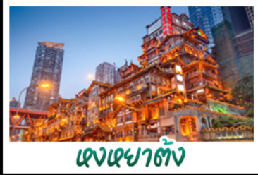
ขงเยาตัง