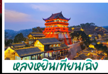
หลงเจินนทีชนเจิง