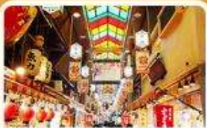
ตลาดปลาเนชิกิ