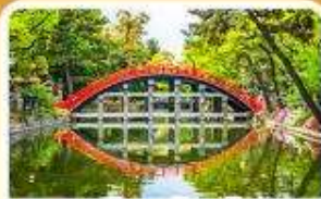
ศาลเจ้าซูมิโยชิ โทคะ