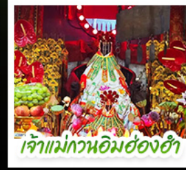
เจ้าแม่กวนอิมฮ่องกงฯ