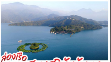
ล่องเรือทะเลสาบสุริยัมจินตรา