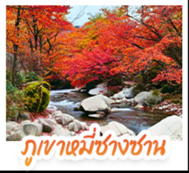
ภูเขาแม่ช้างชาน