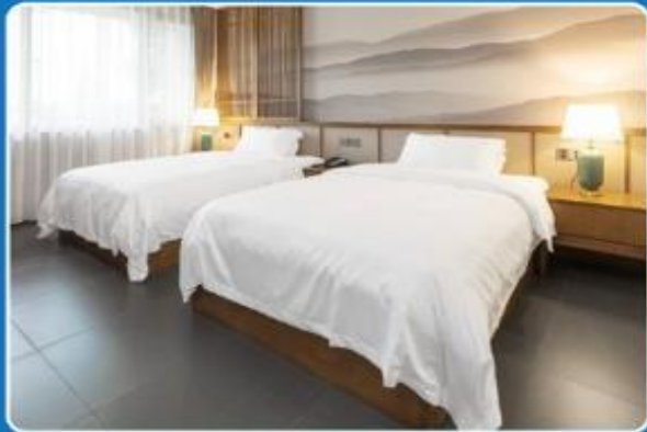
2 PERSONS TWIN (TWN)