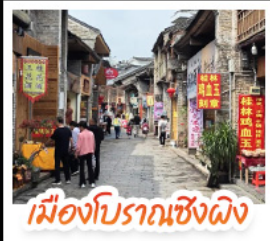
เมืองโบราณเซ็งฉิง

เช็คอินจุดไฮไลท์โลกทัยหลิน เจดีย์เงินเจดีย์ทอง เวางวงช้าง นั่งเคเบิลคาร์สู่ เนาหรือ จุดชมวิวกะหลกเา แห่งเมืองหยางชัว ล่องเรือแม่น้ำสี่เจียง ตามรอยช้างหลังกาพรนบัตร 20 หยวน อิสระ ช้อปปิ้งถนนคนเดิน 2 แห่ง ถนนดงซีเซียง ถนนซีเซียง นั่งกระเช้าบอลูนชมวิวแบบ 360 องศา