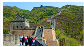
กำแพงเมืองจีนด่านจวิ้งกวน

UNIVERSAL STUDIO BEIJING DISNEYLAND SHANGHAI รถไฟความเร็วสูง - ถ่ายรูปทอโม่ทุก กำแพงเมืองจีนด่านจวิ้งกวน มือพิเศษ เปิดปักกิ่ง, สุกี่หม้อไฟ BUFFET