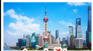
ถ่ายรูปตอโม่ทุก