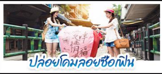
ปลอ้อคอมลอยซือเฟิน