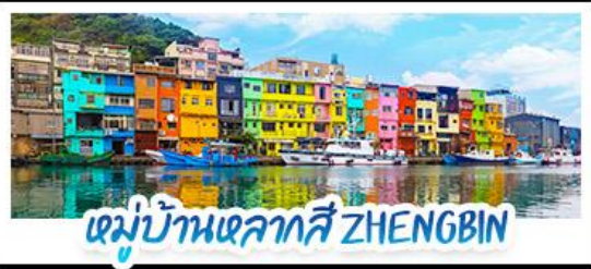
หมู่บ้านหลากสี ZHENGBIN

18 - 21 ก.ค. 69 | 12 - 15 ก.ย. 69 15 - 18 ส.ค. 69 | 28 - 31 ต.ค. 69