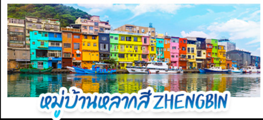
หมู่บ้านหลากสี ZHENGBIN

18 - 21 ก.ค. 69 | 12 - 15 ก.ย. 69 15 - 18 ส.ค. 69 | 28 - 31 ต.ค. 69