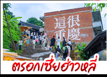
ตรอกซี้ซ่าวหลี่