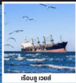
เรือสุ เวยส์