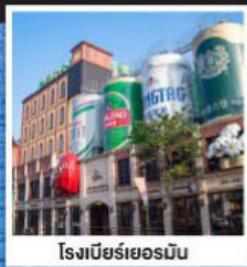
โรงเบียร์เยอรมัน