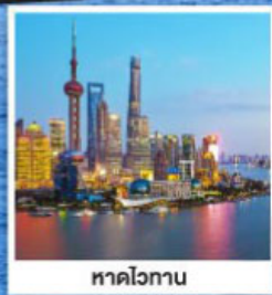
หาดไวทาน