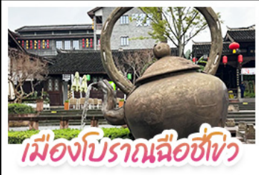
เมืองโบราณฉือชี่เว