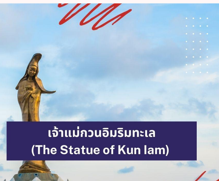
เจ้าแม่กวนอิมริมทะเล (The Statue of Kun lam)