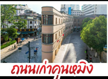
ถนนเก่าคุณเหมิง