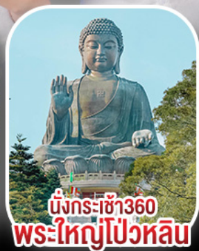
นั่งกระเช้า360 พระใหญ่ไป๋หวลีน