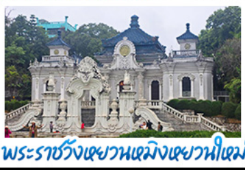
พระราชวังเฉวหนเหมิงเฉวหนี่เหม่