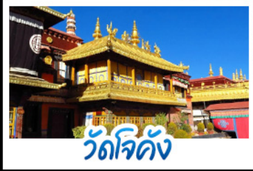
วัดโจคัง