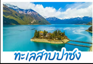
ทะเลสาบปาซง

รถไฟสายหลังคาโลก - พระราชวังโปตาลา วัดโจคัง - ทะเลสาบปาซง พระราชวังฤดูร้อนแอร์บูคิงดา