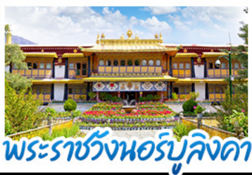
พระราชวังฤดูร้อนแอร์บูคิงดา