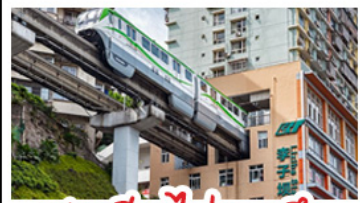
สถานีรถไฟทะเลคุตัก