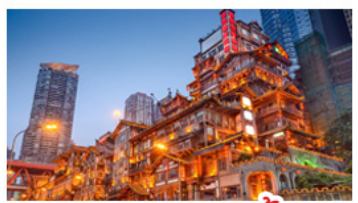
ตลาดแดงเซาตัง