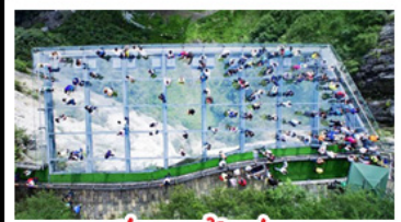
ระเบียงแก้วอุ้งหลง