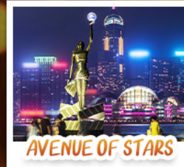
AVENUE OF STARS