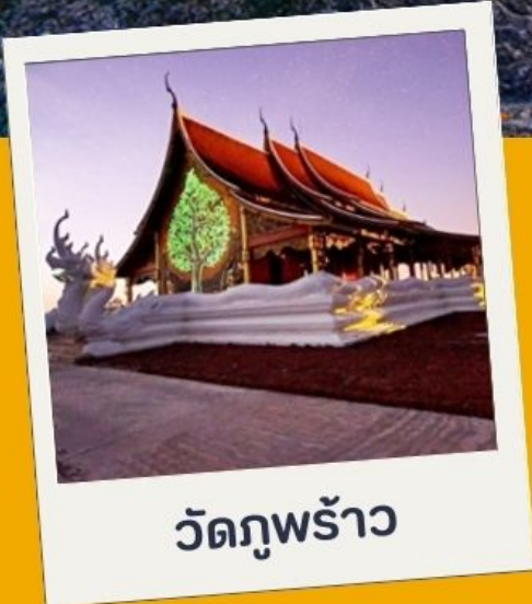
วัดภูพร้าว