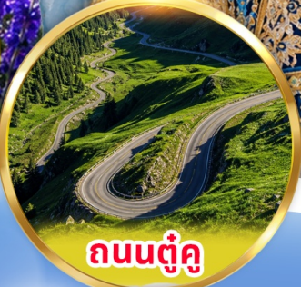
ถนนตุ๋นคู