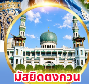
มัสยิดตงควอน