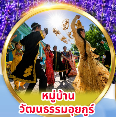
หมู่บ้าน วัฒนธรรมอูยกูร์

พิเศษ นั่งรถม้า + ซิมโอศกรีมอูยกูร์ ชมการแสดง