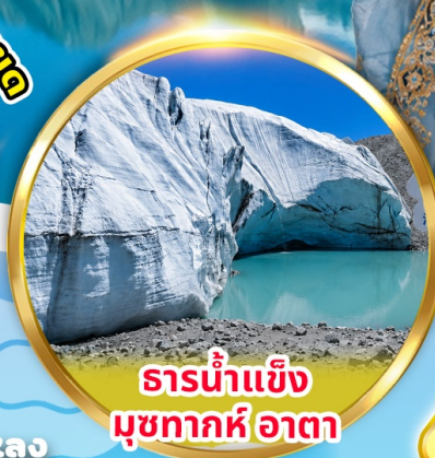
ธารน้ำแข็ง มุขทาก์ อاتا