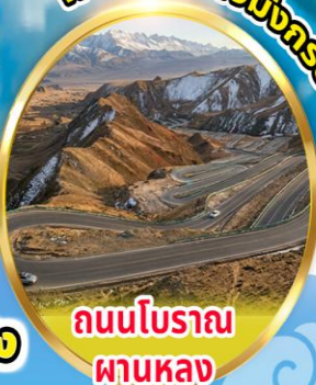
ถนนโบราณ ผานหลง