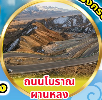
ถนนโบราณ ผานหลง