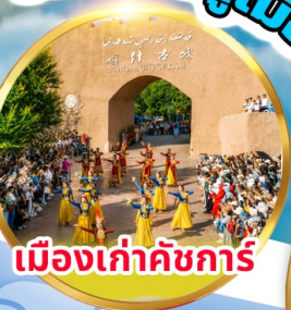
เมืองเก่าคัชการ์