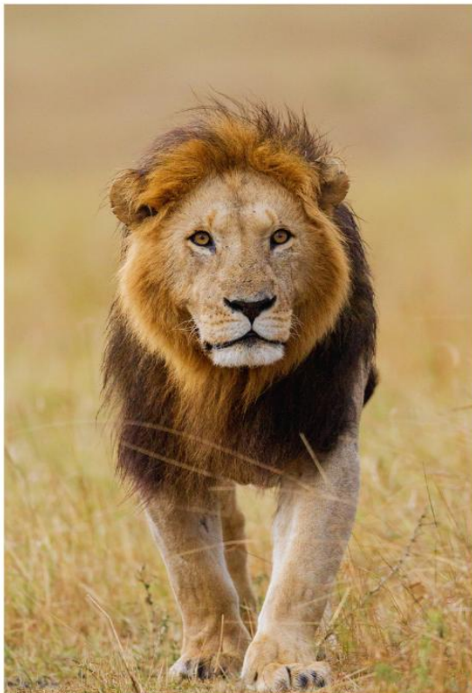
BIG FIVE GAME DRIVE

สัมผัสประสบการณ์สุดตื่นเต้น ชมสัตว์ป่าอย่างใกล้ชิดท่ามกลางธรรมชาติอันอุดมสมบูรณ์ ตื่นตาตื่นใจไปกับ "Big Five" อันเลื่องชื่อ ได้แก่ สิงโต ช้าง แรด ควายป่า และเสือดาว ที่ออกมาใช้ชีวิตอย่างอิสระในถิ่นอาศัยตามธรรมชาติ อีกหนึ่งไฮไลท์ที่ไม่ควรพลาด คือโอกาสในการชมปรากฏการณ์การอพยพของสัตว์ป่าขนาดใหญ่ ซึ่งชวนให้นึกถึงภาพอันยิ่งใหญ่คล้ายของ Maasai Mara National Reserve ที่มีชื่อเสียงระดับโลก