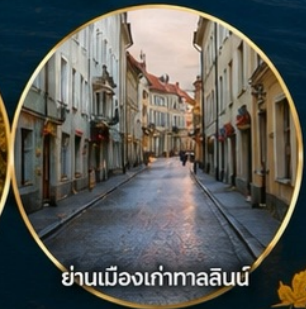
ย่านเมืองเก่าทาลลินน์