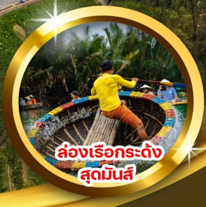
ล่องเรือกระดัง ลุดมินส์