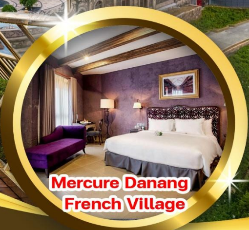
Mercure Danang French Village