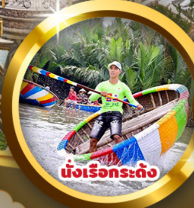
นั่งเรือกระดง