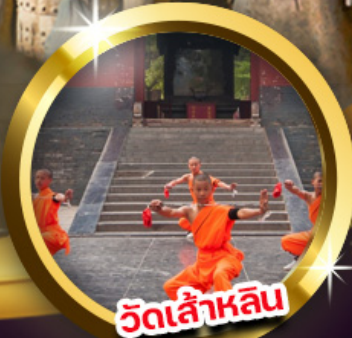
วัดเล่าหลิน