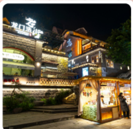
ตลาดโบราณหลงเหมินฮ่าว

ไฮไลท์ อุทยานเขานางฟ้า อุทยานแห่งชาติหลุมฟ้า 3 สะพานสวรรค์ พาหิณแกะสลักตัวจู้ เขาป่าตึงชาน มรดกโลกระดับ 5 A