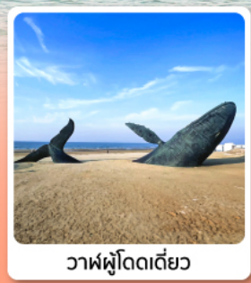
วาฬผู้โดดเดี่ยว