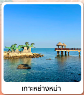
เกาะหย่างหม่า