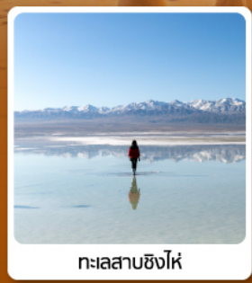
ทะเลสาบซิงไห่