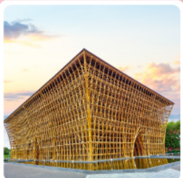
บ้านไม้ไผ่