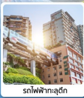
รถไฟฟ้ากะลุดี้ก

ไฮไลท์! อุทยานเขานางฟ้า ดินแดนแห่ง 4 สิ่งมหัศจรรย์ มรดกโลก5A พาซินแกะสลักต้าจู้ เขาเป่าตึงซาน อลังการงานแกะสลัก มรดกโลก5A