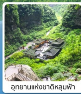
อุทยานแห่งชาติหลุมฟ้า

เดินทาง เมษายน - มิถุนายน 2569 ราคาเริ่มต้น 15,888