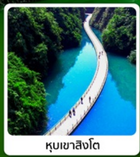
คุนเขาสิงโต