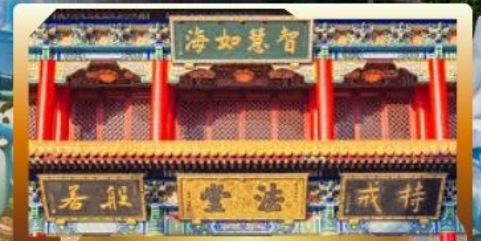
วัดจันทิ