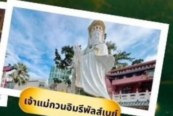
เจ้าแม่กวนอิมริฟัสเบย์