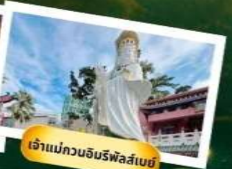
เจ้าแม่กวนอิมรฟัสสึเบย์