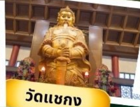
วัดเขากง