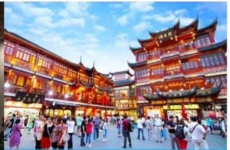
ย่านเจิงหวงเมี้ยว