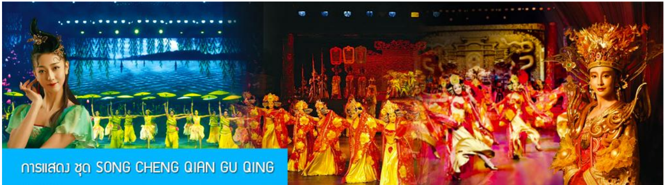
การแสดง ชุด SONG CHENG QIAN GU QING